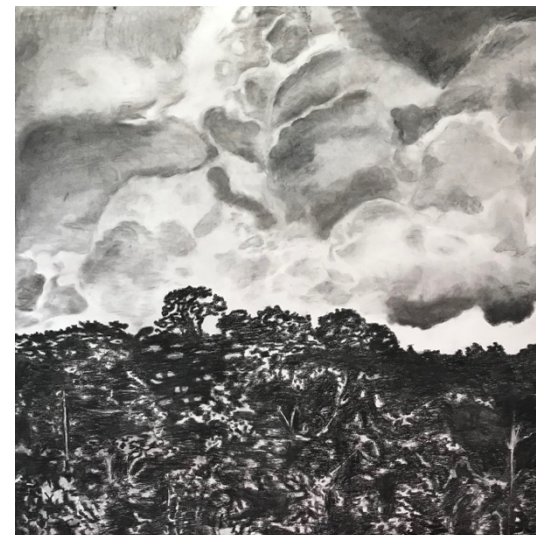
Classe 2Cad, fusain