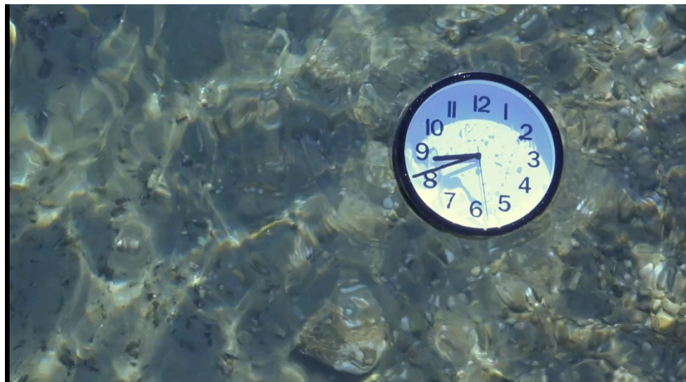
Elizaveta Neronova, capture d'écran

Les bâtiments sont ouverts du lundi au vendredi de 07h30 à 18h30.